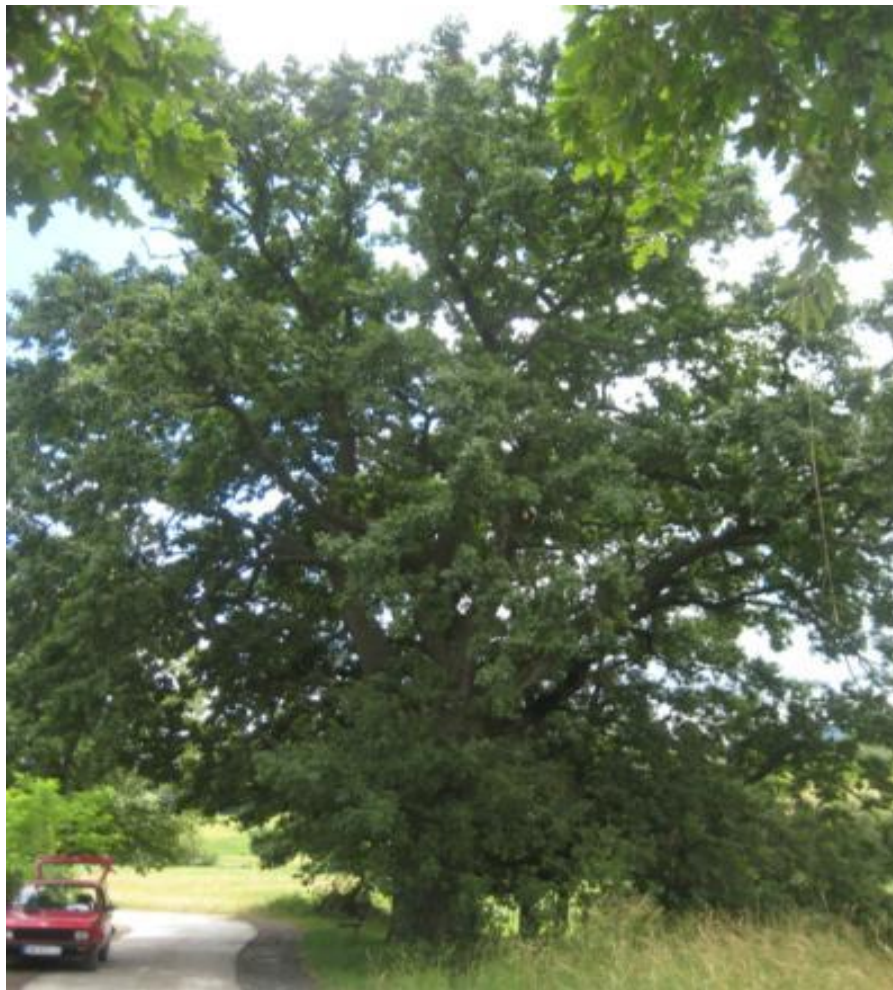
Сл. бр. 11. Споменик природе "Стабло храста цара"-Доња Црнућа (аутор:Радојко Петровић)

Проглашено је заштићеним Одлуком о заштити споменика природе "Стабло храста цара" која је објављена у Службеном гласнику општине Горњи Милановац бр. 6/94. Ово природно добро има изузетну естетску вредност, иако је делимично редуковане крошње. Доброг је здравственог стања, знатне виталности и плодности.