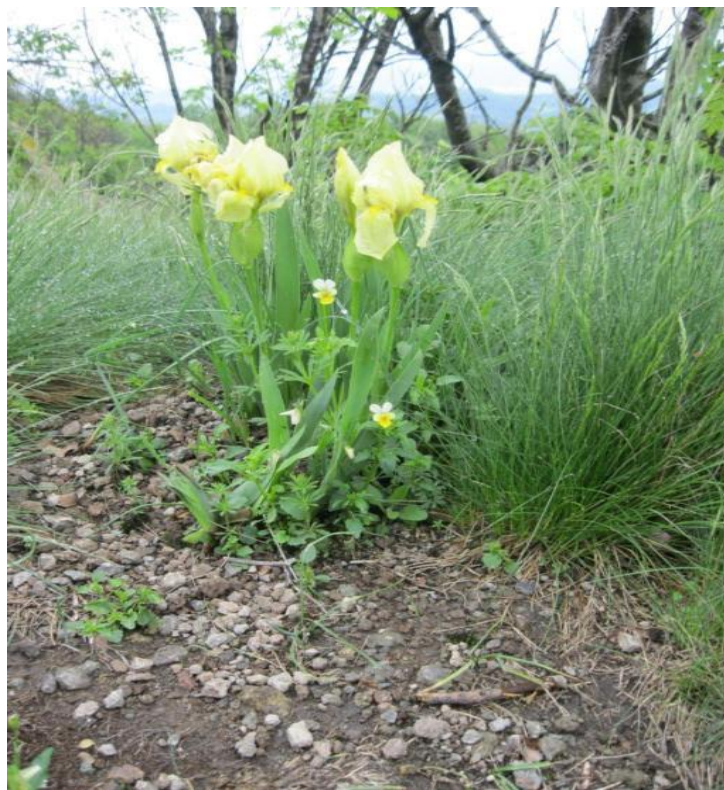
Слика бр. 6. Рајхенбахова перуника ( Iris reichenbachii ) на Островици

Подручје Островице се налази у зони термофилних сладуново-церових шума. По флористичком значају и диверзитету издвајају се станишта стена и камењара на коме опстају: балканско-карпатски ендемит Рајхенбахова перуника ( Iris reichenbachii ) (сл. бр. 6), балкански ендемит мишјакиња ( Minuartia hirsuta subspec. falcata ), и арктирчки флорни елемент каменика ( Saxifraga aizoon ).