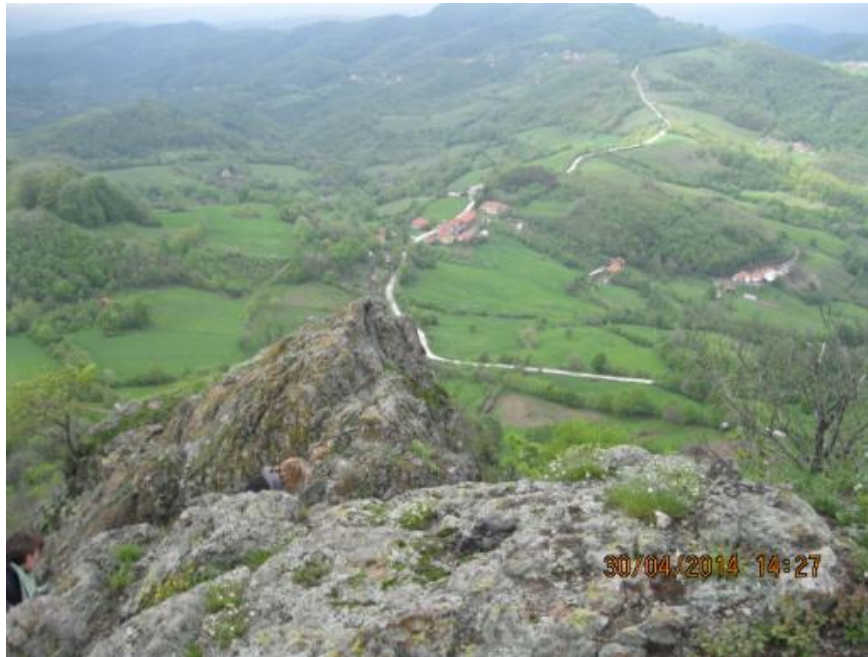
Слика бр. 5. Поглед са Островице

У времену српске деспотовине била је најзначајнија трвђава у овој области.