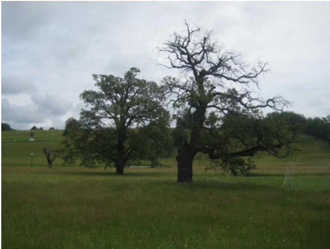
Сл. бр. 10. Два храста лужњак "Таковски грм" (аутор:Радојко Петровић)

Природни споменик има историјски, културни и туристички значај. Храстови су остаци некадашњих густих шума низинског храста лужњака. Заштићена стабла се налазе на поростору под ливадама и представљају и естетску вредност овог краја.