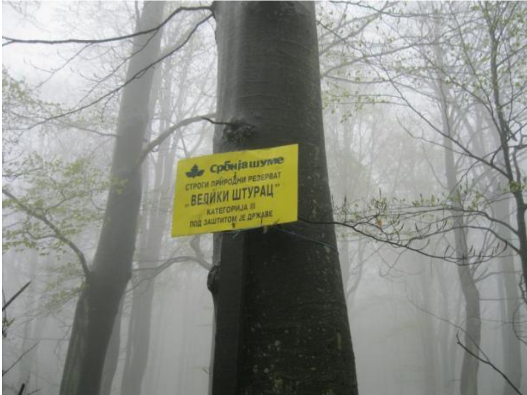
Сл. бр. 7. Ознака заштићеног природног добра "Велики Штурац"

Строги природни резерват "Велики Штурац" (сл. бр. 7.) стављен је под заштиту решењем Завода за заштиту природе и научно проучавање природних реткости НР Србије, бр. 33 од 20.09.1956. године. Одлука о заштити објављена је у Службеном гласнику НРС бр. 52/1956.