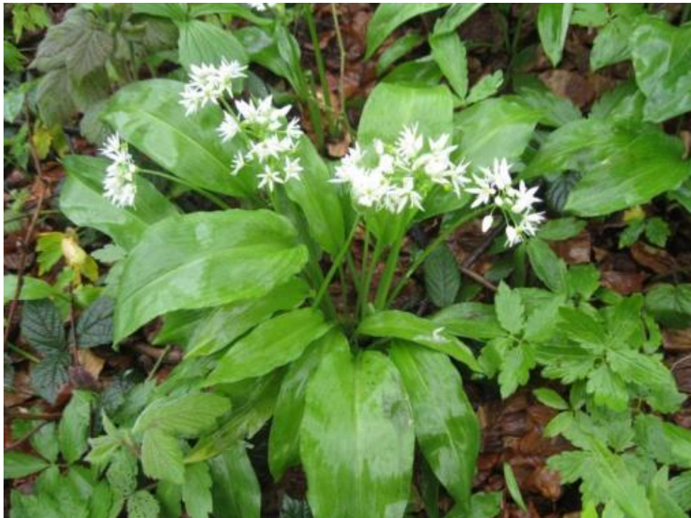
Сл. бр. 9. Медвеђи лук ( Allium ursinum )

У резервату је заступљена крупна и ситна дивљач (срна, дивља свиња, куне и др.), а присутна је и карактеристична врста птица као природна реткост и индикатор старих и очуваних жума- црна жуна ( Dryocopus martinus ).