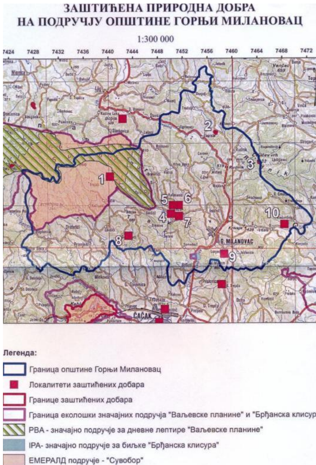
Слика бр.1 Заштићена природна добра на подручју општине Горњи Милановац (Завод за заштиту природе Србије)

На територији општине Горњи Милановац налазе се значајне природне вредности (сл. бр. 1.):