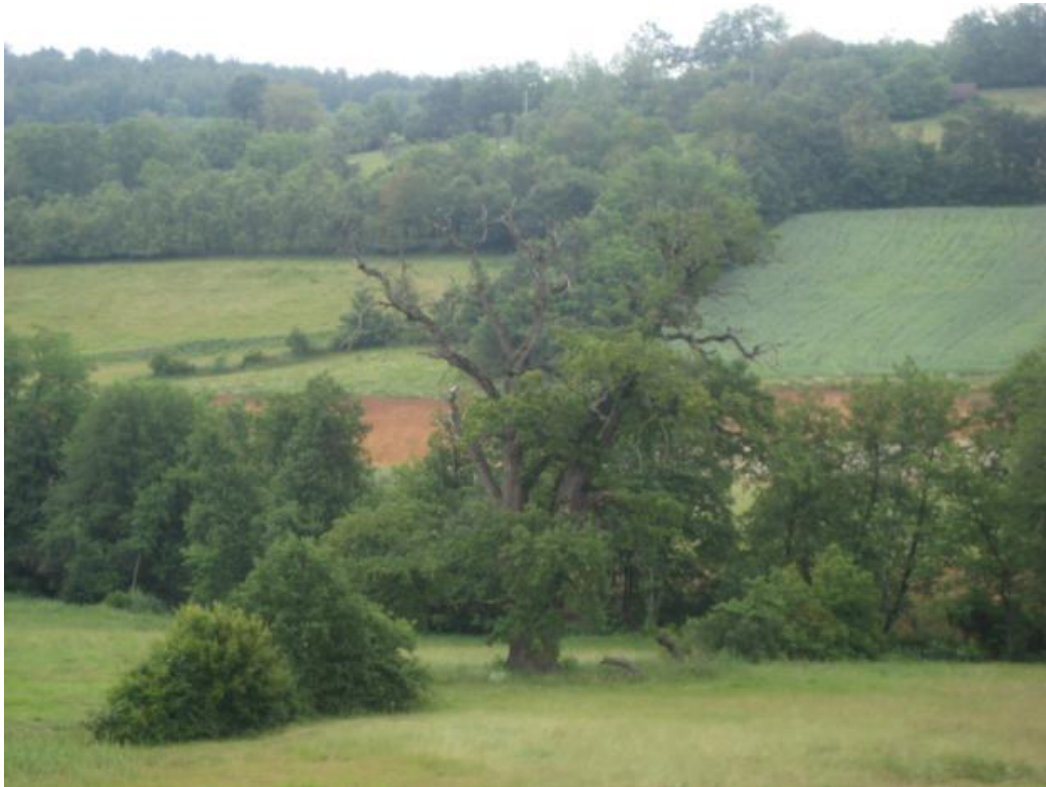
Сл. бр. 12. Споменик природе "Храст лужњак Стражев"

Положај споменика природе одређен је координатама по Гриничу: 44^{\circ}44'44''/20^{\circ}23'36'' . Споменик природе "Храст лужњак Стражев" заштићен је Одлуком СО Горњи милановац бр. 1-06-58/94. Споменик природе "Храст лужњак Стражев" има следеће дендрометријске карактеристике: