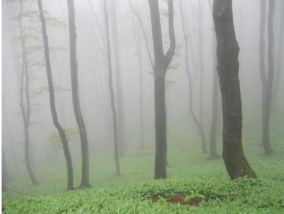
Сл. бр. 8. Шума планинске букве са медвеђим луком