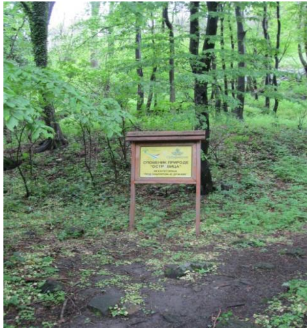
Слика бр. 3. Споменик природе Островица-ознака заштићеног природног добра (аутор: Даниела Глишовић)

Према категоризацији заштићених природних добара Републике Србије, Островица је категорисана као Споменик природе, односно, значајно природно добро III категорије (сл. бр. 3. ).