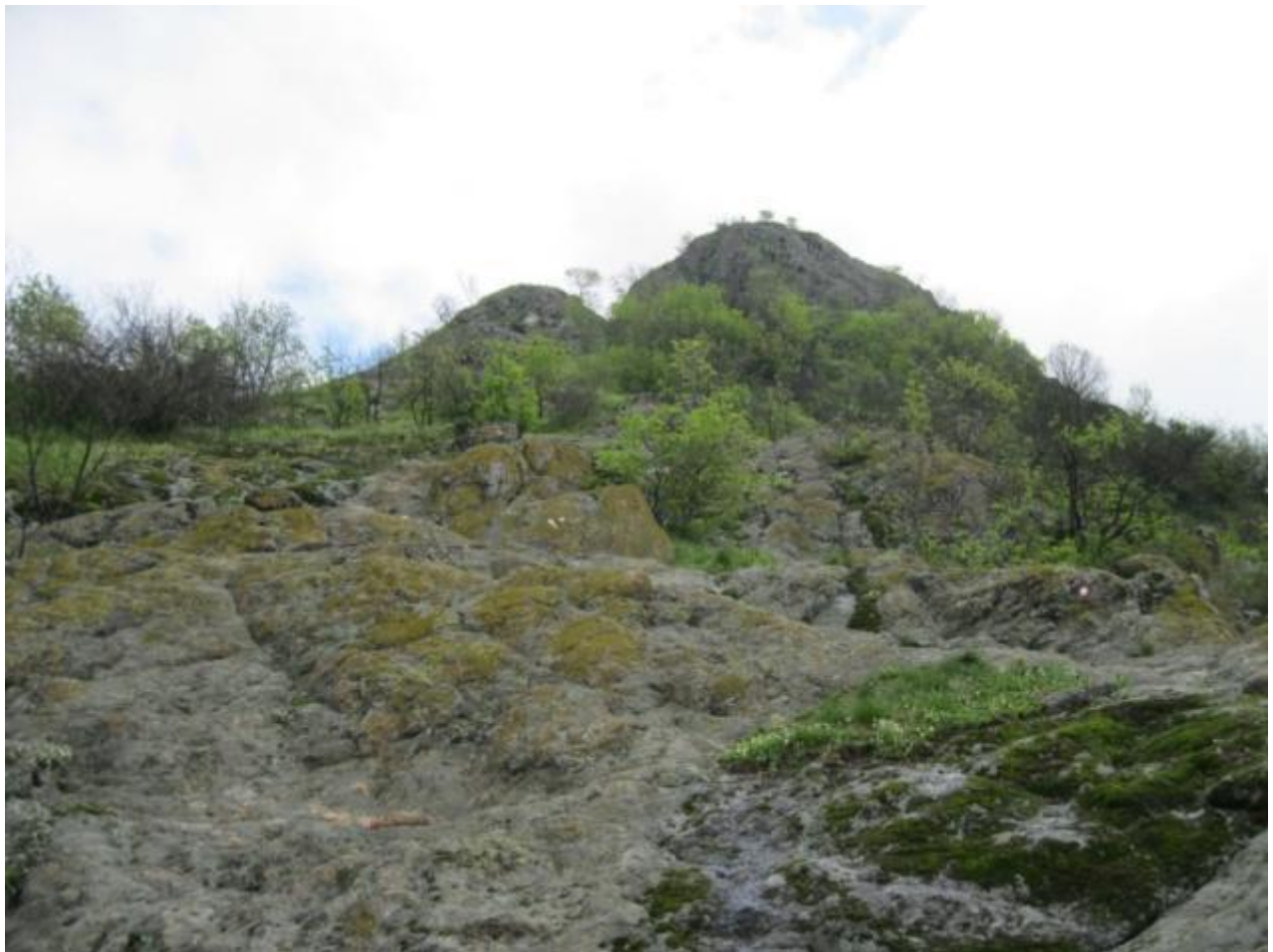
Слика бр. 2. Споменик природе "Островица"

Споменик природе „Островица“ (сл. бр. 2.) налази се у Шумадији и припада северозападним огранцима планине Рудник. Од Горњег Милановца је удаљен 15 km, од варошице Рудник 4,5 km, а од Београда 120 km. Припада територији општине Горњи Милановац, катастарској општини Заграђе.