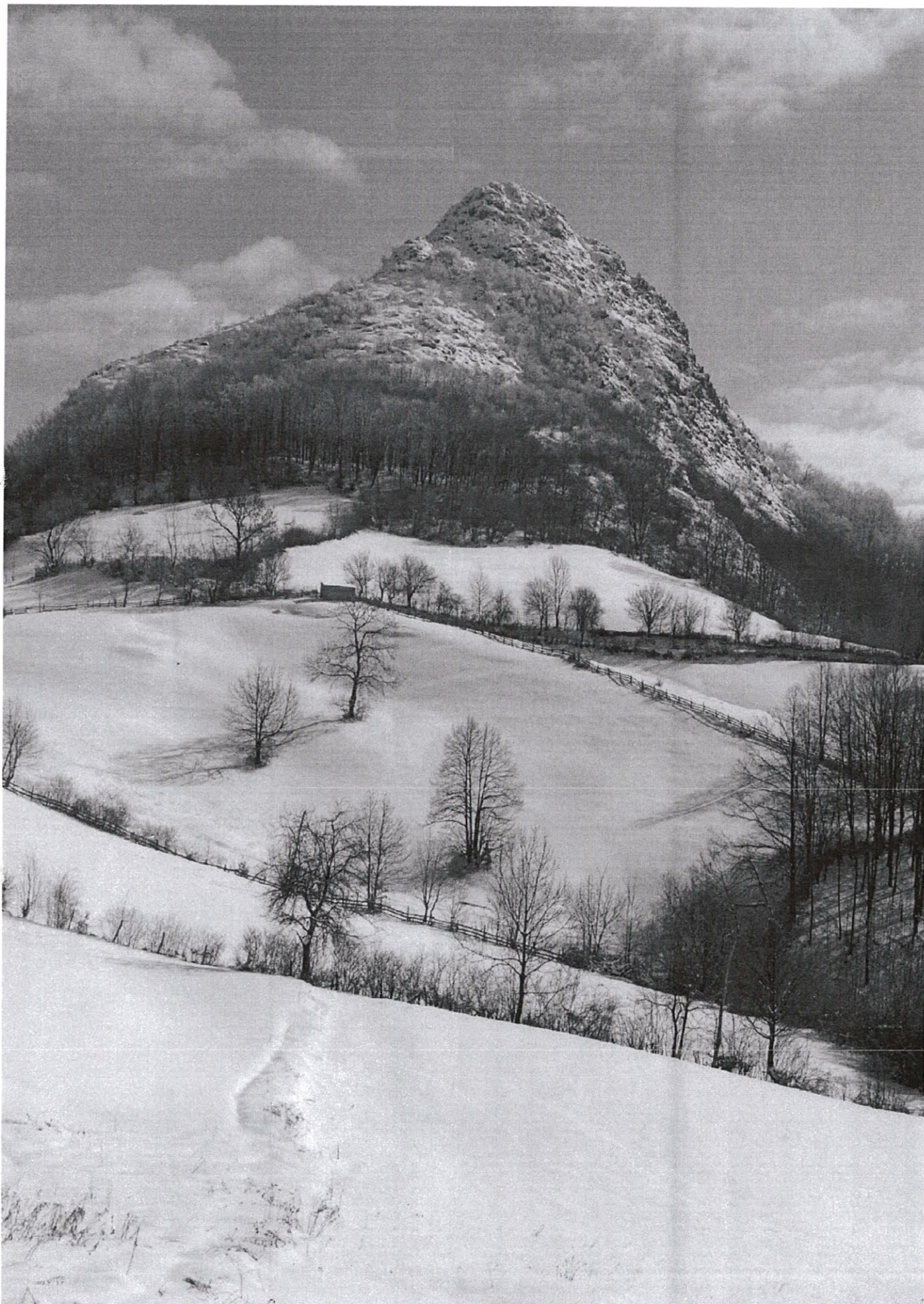
Споменик природе „ОСТРОВИЦА“